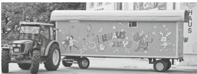
Wieder unterwegs: Der Spielbus fährt zu den Spielplätzen der Stadt. Mit dabei hat er viele Spiele und es kann gebastelt, gebaut, gemalt oder gekocht werden.

Das aktuelle Tagesprogramm kann telefonisch unter der Nummer 07541 386729 oder per E-Mail: spielehaus@friedrichshafen.de erfragt werden. Alle Infos gibt es auch im Internet unter www.spielehaus.friedrichshafen.de und auf instagram.com/spielehaus_spielbus .